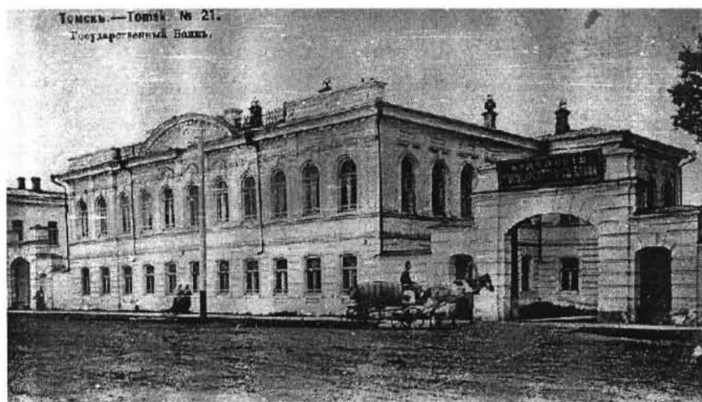
Здание Томского отделения Государственного банка на улице Миллионной, 11 (ныне — проспект Ленина, 125). Построено примерно в 1880 г., предположительно, по проекту В.В. Хабарова. Фото начала XX в.

Чек номиналом 100 руб. (рис. 1). Размер 145×105 мм. Напечатан на красно-оранжевой плотной бумаге без водяных знаков. По всему полю знака нанесён декоративный сетчатый фон. На заднем фоне по центру — геральдическая фигура тёмно-красного цвета в виде стилизованных перекрещённых букв «ТОГБ». По центру в орнаментальной рамке чёрного цвета помещён текст в пять строк: «Томское отделение